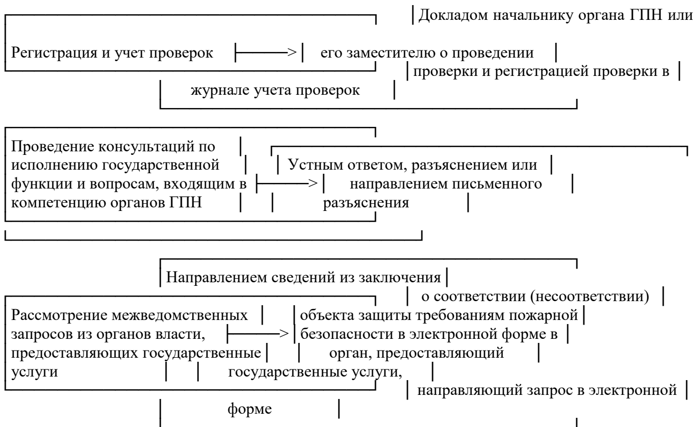
Рисунок 1 - Исполнение федерального государственного пожарного надзора